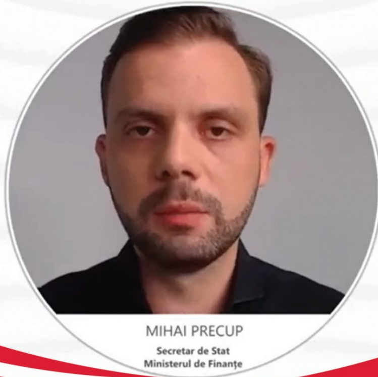
MIHAI PRECUP Secretar de Stat Ministerul de Finanțe